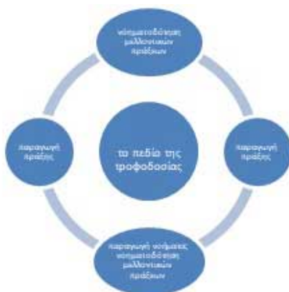
Σχήμα 3: Η διαλογική αλληλεπιδραστική σχέση μεταξύ του Πράττειν και της Παραγωγής Νοήματος

Το πεδίο της τροφοδοσίας συνδέεται επίσης με τις ιδέες των B. Pearce & V.Crohen σχετικά με τον Συντονισμό των Νοημάτων. Οι Pearce & V.Crohen εστιάζουν και αναδεικνύουν την διαλογική σχέση ανάμεσα στην Πράξη και το Νόημα.