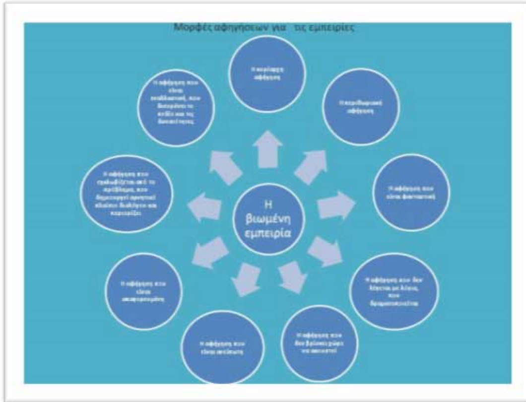
Σχήμα 2 : Οι μορφές των Αφηγήσεων και η σχέση με την βιωμένη εμπειρία.

Σε σχέση με τις μορφές αφήγησης ( Hermans J.M.H., & Hermans-Konopka A. 2016, Littlejohn S.W, Foss. K.A. 2012) έχουμε περιγράψει σε ένα εργαστήριο για τον Ηθικό Αναστοχασμό, που παρουσιάσαμε σε δυο επιστημονικές ημερίδες τον Δεκέμβριο 2018 και που δημοσιεύσαμε στην συνέχεια στο Blog της ΕΛΕΣΥΘ [8], ότι υπάρχουν μια σειρά από αλληλοεξαρτώμενες μορφές, στις οποίες αποτυπώνονται τόσο οι διαφορετικές γραμματικές των αφηγήσεων (π.χ. το είδος της γλώσσας και το εάν αυτή θα είναι λεκτική ή εξωλεκτική), όσο και οι διαλογικές και διαλεκτικές σχέσεις που υπάρχουν μεταξύ τους ή μεταξύ αυτών και των εξωτερικών πλαισίων.