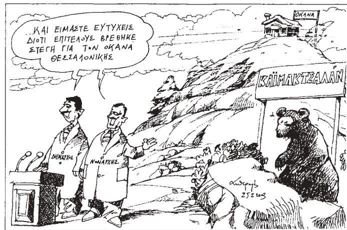
Σκίτσο του Ανδρέα Πετρουλάκη από την εφημερίδα "Η Καθημερινή"

Η Θεσσαλονίκη, η δεύτερη μεγάλη πόλη της χώρας, έχει μεν σημαντικό πρόβλημα ναρκωτικών, αλλά τα μεγέθη είναι ακόμη πεπερασμένα, σε σύγκριση με αυτά των