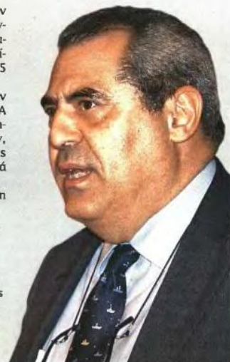
* Καθηγητής Επιδημιολογίας και Προληπτικής Ιατρικής, Διευθυντής Εργαστηρίου Υγιεινής, Επιδημιολογίας και Ιατρικής Στατιστικής Ιατρικής Σχολής Πανεπιστημίου Αθηνών.

Παρά την πρόοδο που έχει συντελεστεί, ο αριθμός θεωρείται κατά πολύ χαμηλότερος από αυτόν που ορίζεται από τους διεθνείς οργανισμούς και από τις πραγματικές ανάγκες των χρηστών.