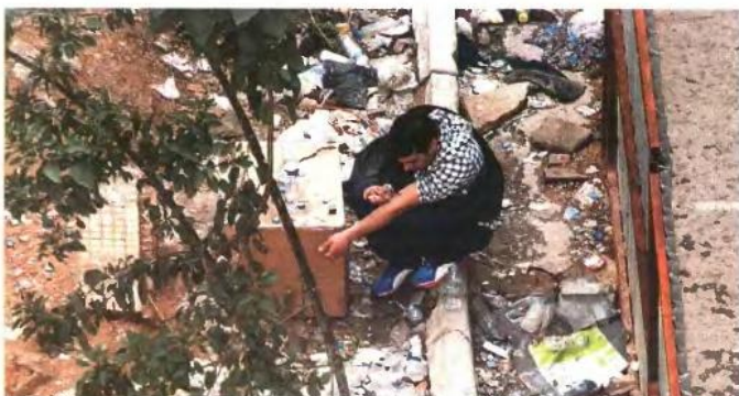
Κατά 35% αυξήθηκε ο αριθμός των χρηστών που εισήλθαν σε προγράμματα υποκατάστασης, καθώς από τον Αύγουστο του 2011 έχουν δημιουργηθεί 27 νέες μονάδες.